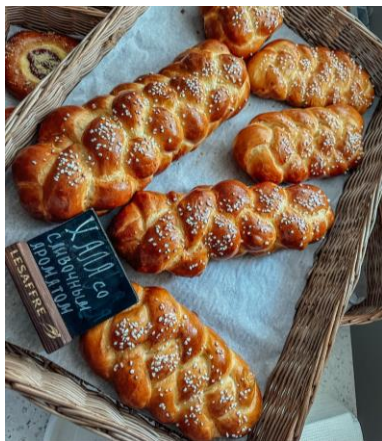
Хала со сливочным ароматом - этническое хлебобулочное изделие на Инвентис Софт Крема;