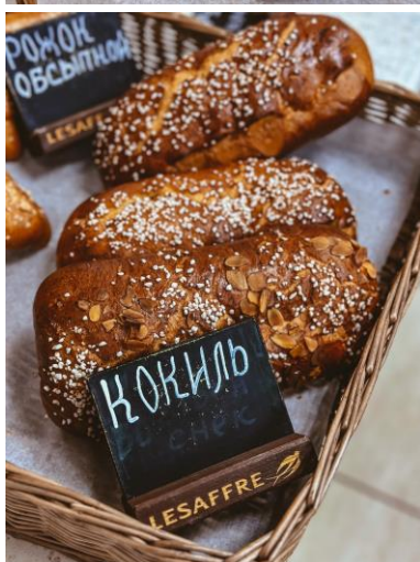
Кокиль - французская сдоба с изюмом и кусковым сахаром.