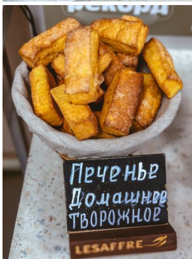
Творожное дрожжевое печенье;