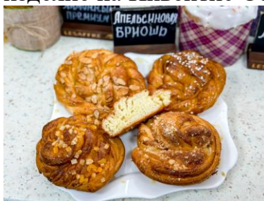
Апельсиновая бриошь - сдоба с апельсиновой начинкой;