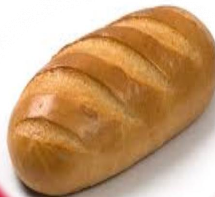
Свежих хлебов и батонов