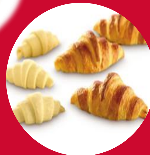
Замороженных хлебов и слоек