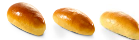
Sunset Glaze pure

Sunset Glaze можно наносить до и после заморозки